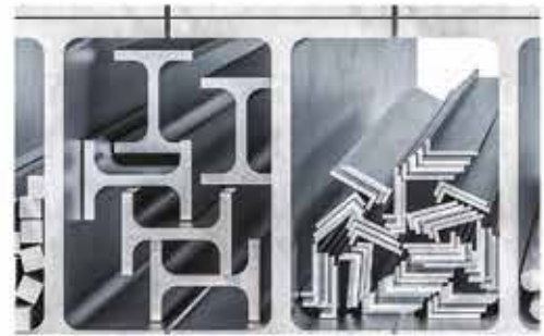
NPI NPU KÖŞEBENT LAMA