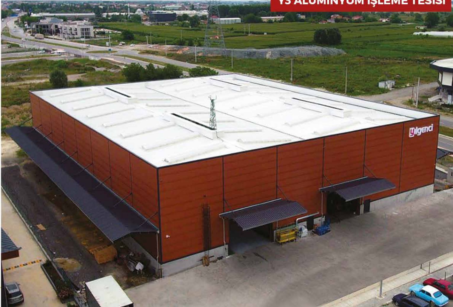
Y3 ALÜMİNYUM İŞLEME TESİSİ