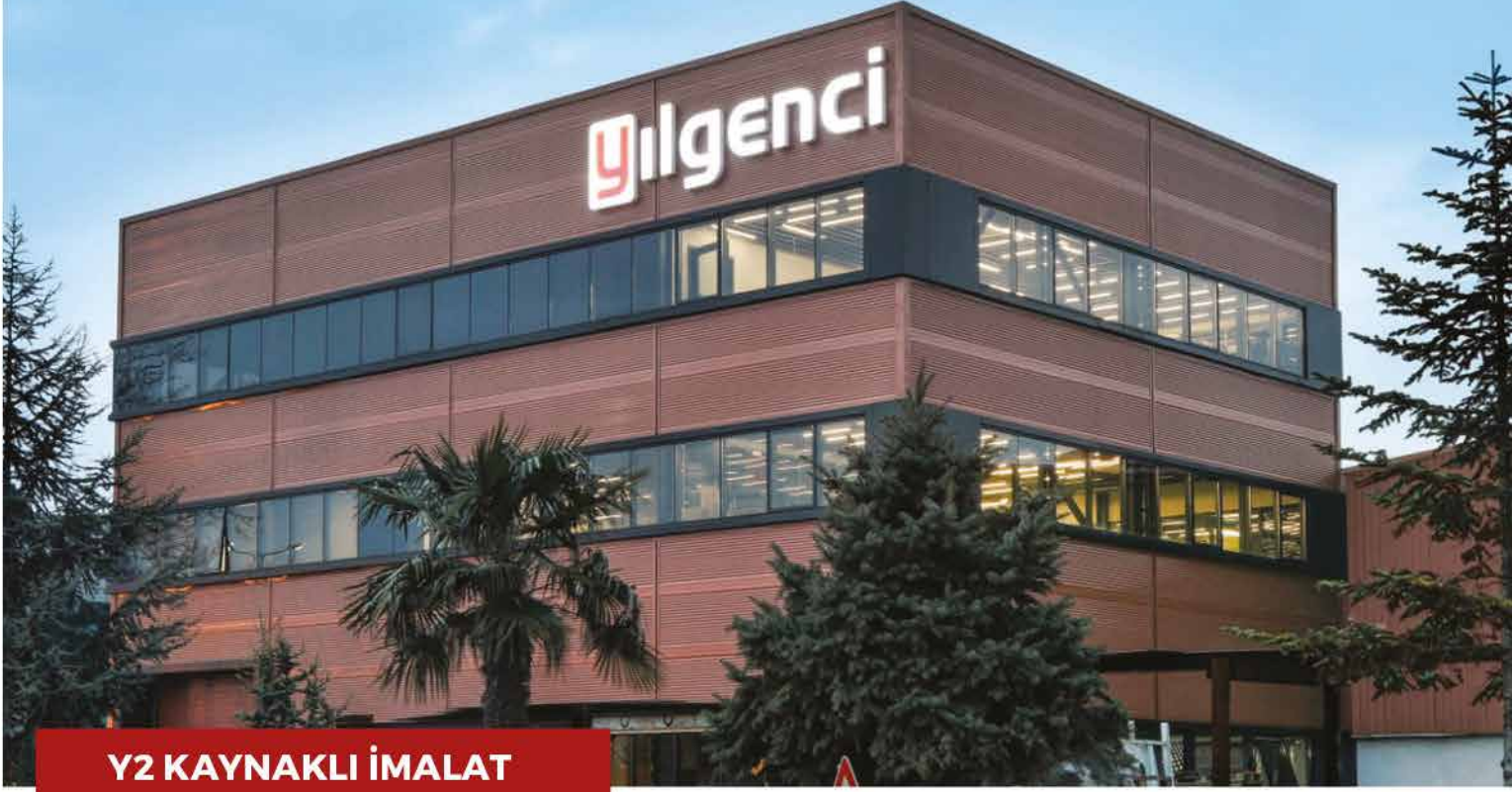
Y2 KAYNAKLI İMALAT